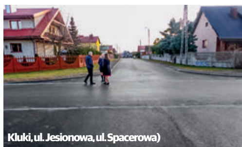
Kluki, ul. Jesionowa, ul. Spacerowa)